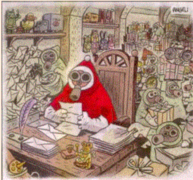
Merry Antrax and a happy new year.