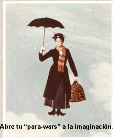
Abre tu "para-wars" a la imaginación.